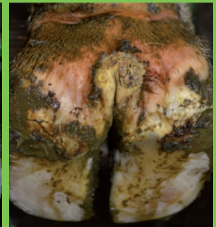
Wiederkehrende akute Läsion auf chronischem Mortellaro

gut es geht vermieden werden. Eine regelmäßige Klauenpflege gilt als eine der wichtigsten Prophylaxemaßnahmen.