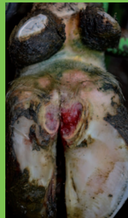
akute Dermatitis Digitalis Läsion

Auf einer gesunden Haut können die bakteriellen Erreger der Dermatitis digitalis keinen Schaden anrichten. Übertragungsversuche haben nur dann funktioniert, wenn die Haut zuvor mit Gülle und mangelnder Luftzufuhr präpariert wurde. Deshalb ist auf die Hygiene großen Wert zu legen. Laufgänge müssen trocken und eben sein, um Staunässe zu verhindern. Nur im Liegen wird die Klaue entlastet und vor allem auch Abtrocknen. Deswegen müssen die Liegeboxen so gestaltet werden, dass die Kühe 12 bis 14 Stunden liegen . Ein weiterer wichtiger Faktor in der Dermatitis digitalis Prophylaxe ist ein starkes Immunsystem . Negative Stoffwechseleinflüsse sollten daher so