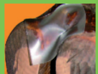
Mortella Heal® (Dr. Kenndoff)

Ein neuartiges Pflaster Mortella Heal® von Dr. Kenndoff zeigt verblüffend gute Wirkung. Dieses Pflaster wird mittels Verband 10 Tage auf der Läsion fixiert. Darunter bildet sich eine neue intakte Haut, die besonders gegen Neuinfektionen recht widerstandsfähig zu sein scheint. Das Pflaster ersetzt sozusagen den Schorf und wirkt aufgrund des feuchten Wundmilieus schmerzlindernd Gerade bei Behandlungen mit Nova-